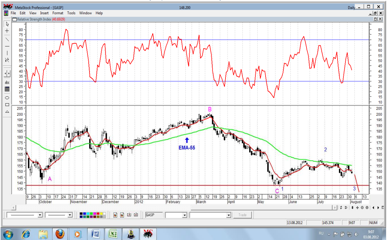
График акций Лукойла