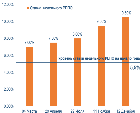
В течение года ключевая ставка ЦБ ставка выросла на 500 б.п., практически удвоившись